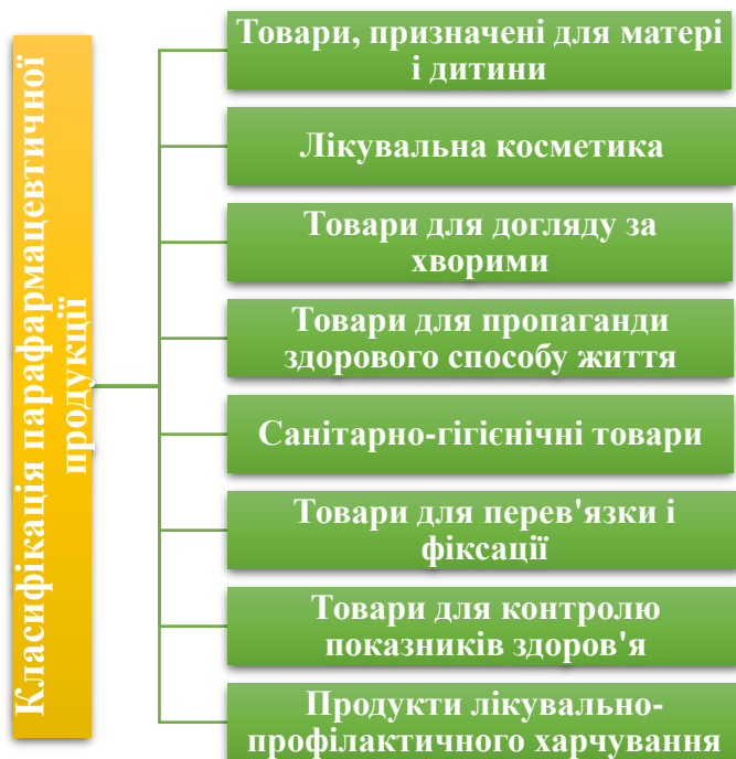
Рисунок 1. Класифікація парафармацевтичної продукції [2]

Товари, призначені для матері і дитини – це спеціалізоване білизна для вагітних і годуючих жінок: бандажі, пояси дородові і післяпологові, пристосування для миття дитини. Комплекти для зціджування молока, памперси, підгузники, пелюшки та інші засоби для гігієни новонароджених та їхніх матерів.