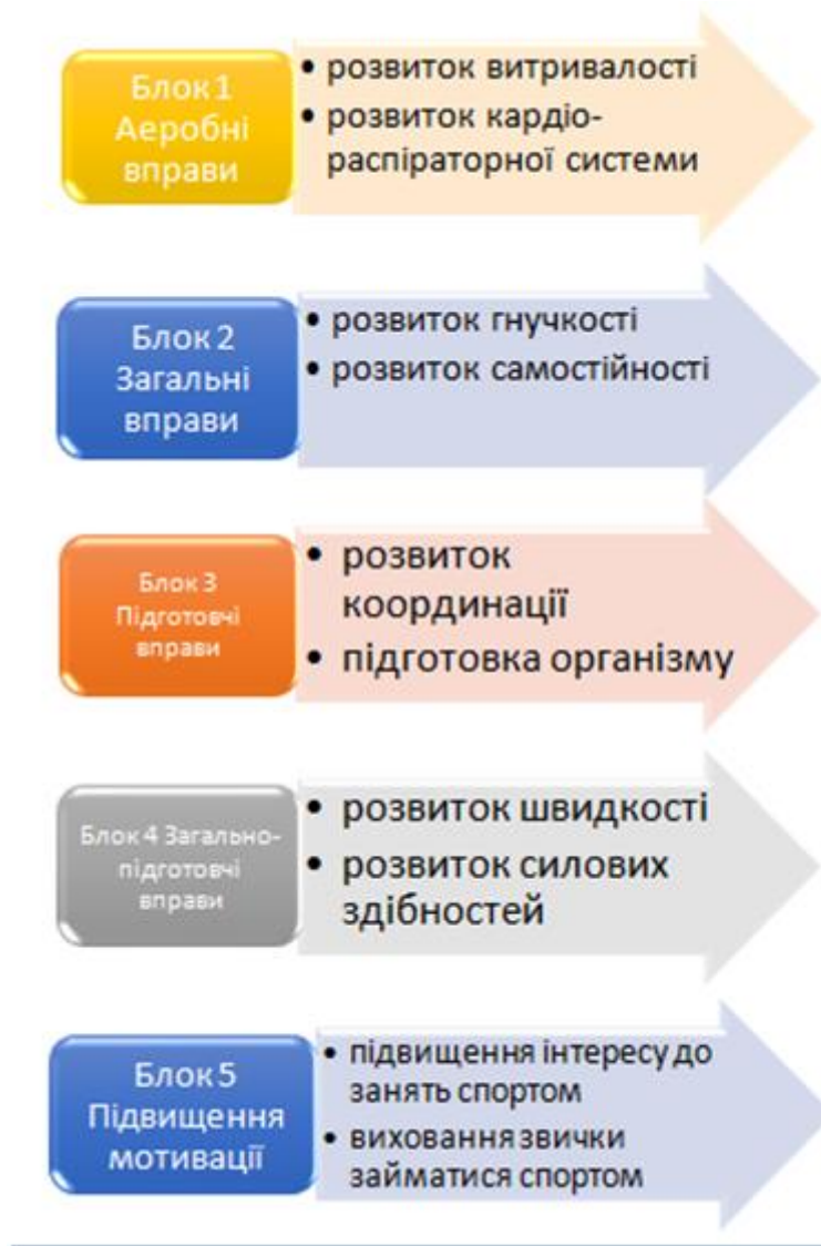
Рис.1. Основні блоки вправ для проведення дослідження

Для реалізації соціологічного опитування була використана анкета, розроблена власноруч автором роботи. Визначення інтересів дитини здійснювалося за результатами відповіді на питання анкети: «Які види дозвілля є найбільш важливими для вас, як ви дійсно проводите своє вільний час?». Аналіз результатів анкетного опитування дозволив зробити висновок про те, що у дітей середнього шкільного віку переважає інтерес до пасивних форм проведення дозвілля. У дівчаток з віком знижується інтерес до фізичної активності, у хлопчиків ставлення до активного способу життя не змінюється в межах середнього рівня.