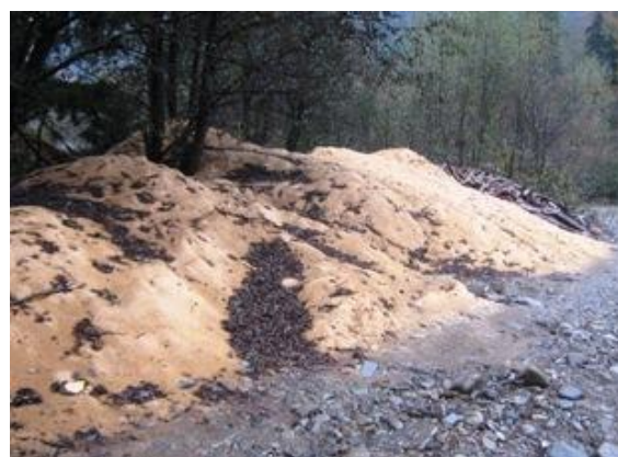
Рис.1,2. Відходи від деревообробної промисловості – сировина для виробництва біопалива

Паливні брикети виготовляються з відходів деревообробних цехів, пилорам та лісового господарства. В основі технології виробництва паливних брикетів лежить процес пресування дрібно подрібнених відходів деревини (тирси) під високим тиском при нагріванні.