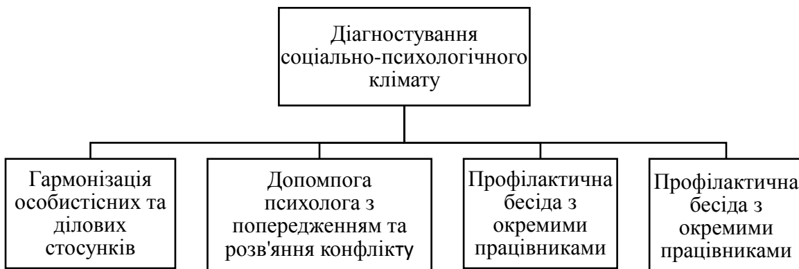
Рисунок - модель діяльності в організації щодо оптимізації СПК [1].

Вивчення соціально-психологічного клімату у колективі становить не тільки науковий, а й практичний інтерес. Проблеми покращання соціально-психологічного клімату у колективах розглядають у своїх працях чимало науковців, зокрема Н. Базалійська [1], Г. Захарчин [2], Г. Горбань [3], Н. Жигайло [4], Н. Беляєв [5]. На думку Н. Базалійської, соціально-психологічний клімат (СПК) – це складне явище, яке поєднує в собі систему взаємовідносин між членами колективу, яка під впливом індивідуальних психофізіологічних особливостей та внутрішньо-групових традицій і стандартів формують певну колективну свідомість та настрій, а також комплекс психологічних умов, які сприяють або перешкоджають продуктивній спільній діяльності й усесторонньому розвитку особи в групі для досягнення цілей окремого індивіда, колективу та підприємства загалом [1].