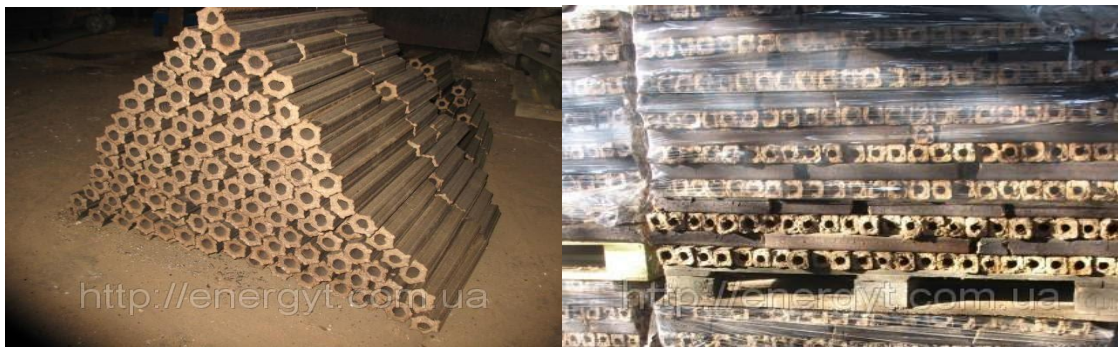
Рис.3,4. Виготовлені та фасовані паливні брикети

6. Розфасовка і упаковка: залежить від того, яка система зберігання існує у споживача. Якщо у вільному вигляді – насипом, у мішках (від 500-1200 кг), у дрібній розфасовці (10-20 кг) [1].