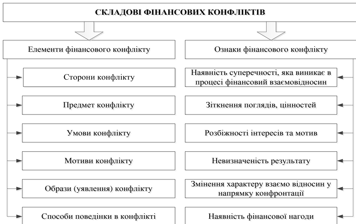
Рисунок 1. Головні складові та ознаки конфліктів у фінансовій площині [6, с. 40]

З метою поглибленого дослідження внутрішньої природи конфлікту у сфері фінансів доцільно виокремити його ключові складові й характерні риси (див. рис. 1).