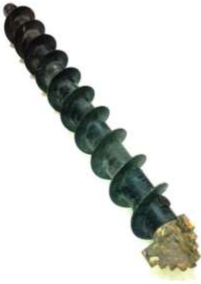
Рис. 1. 3-х лопатеве долото та шнек.

Не виключений варіант пневмоочищення бурового інструменту та самої колони шнеків безпосередньо у процесі зондування, враховуючи наявність хоч і розрідженої, але атмосфери, яка потрібна для роботи компресора особового типу.