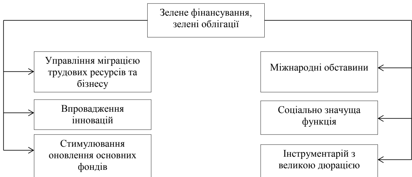
Рис. 1. Роль «зеленого» фінансування та «зелених» облігацій у світовій економіці.

Розвиток світового ринку «зелених» облігацій розпочався в 2007 р., в даний час спостерігається його активний розвиток. Однак на вітчизняному ринку даний фінансовий інструмент недостатньо розвинений, що обумовлено різними факторами. У грудні 2019 р. Європейська комісія представила інвестиційний план під назвою «Зелений пакт для Європи». Це інвестиційний план стійкої Європи, який націлений мобілізувати державні інвестиції та розблокувати приватні кошти через фінансові інструменти Європейської комісії, що призведе до вкладення інвестицій обсягом не менше 1 трлн євро [2]. Приватні інвестори все частіше прагнуть та мають можливість вкладати кошти в клімато-зберігаючі проекти на ринках, що формуються. Однак часто вони не мають у своєму розпорядженні необхідних інструментів для проведення таких інвестицій. Одним з найбільш актуальних і привабливих інструментів «зеленого» фінансування в світі є «зелені» облігації. Роль «зеленого» фінансування і «зелених» облігацій у світовій економіці обумовлена безліччю факторів (рис. 1).